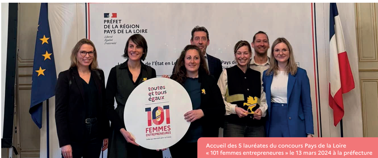
Accueil des 5 lauréates du concours Pays de la Loire « 101 femmes entrepreneures » le 13 mars 2024 à la préfecture

Préfet de la région Pays de la Loire, préfet de la Loire-Atlantique